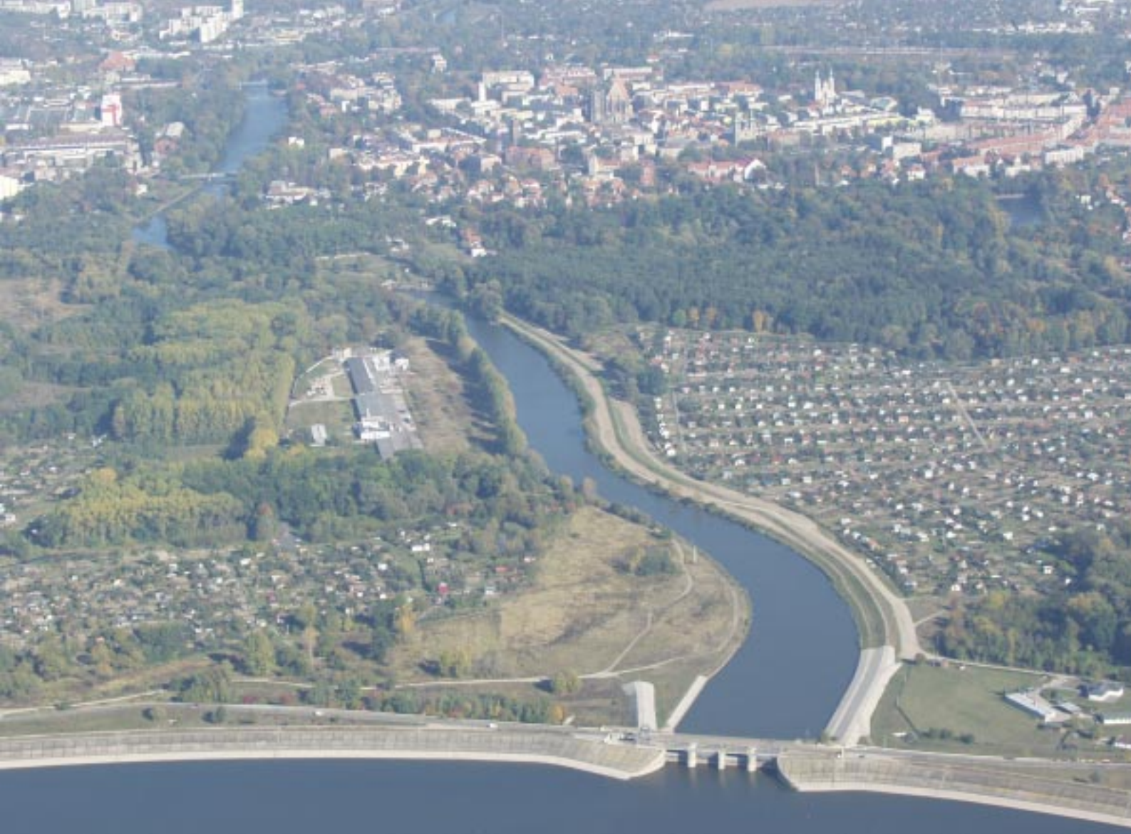
Nysa z lotu ptaka. W dolnej części zdjęcia widoczna tama na Nysie Kłodzkiej Nysa z ptačí perspektivy. V dolní části snímku je vidět hráz Nyského jezera. Nysa aus der Vogelsicht. Unten ist der Deich an der Glatzer Neisse zu sehen.