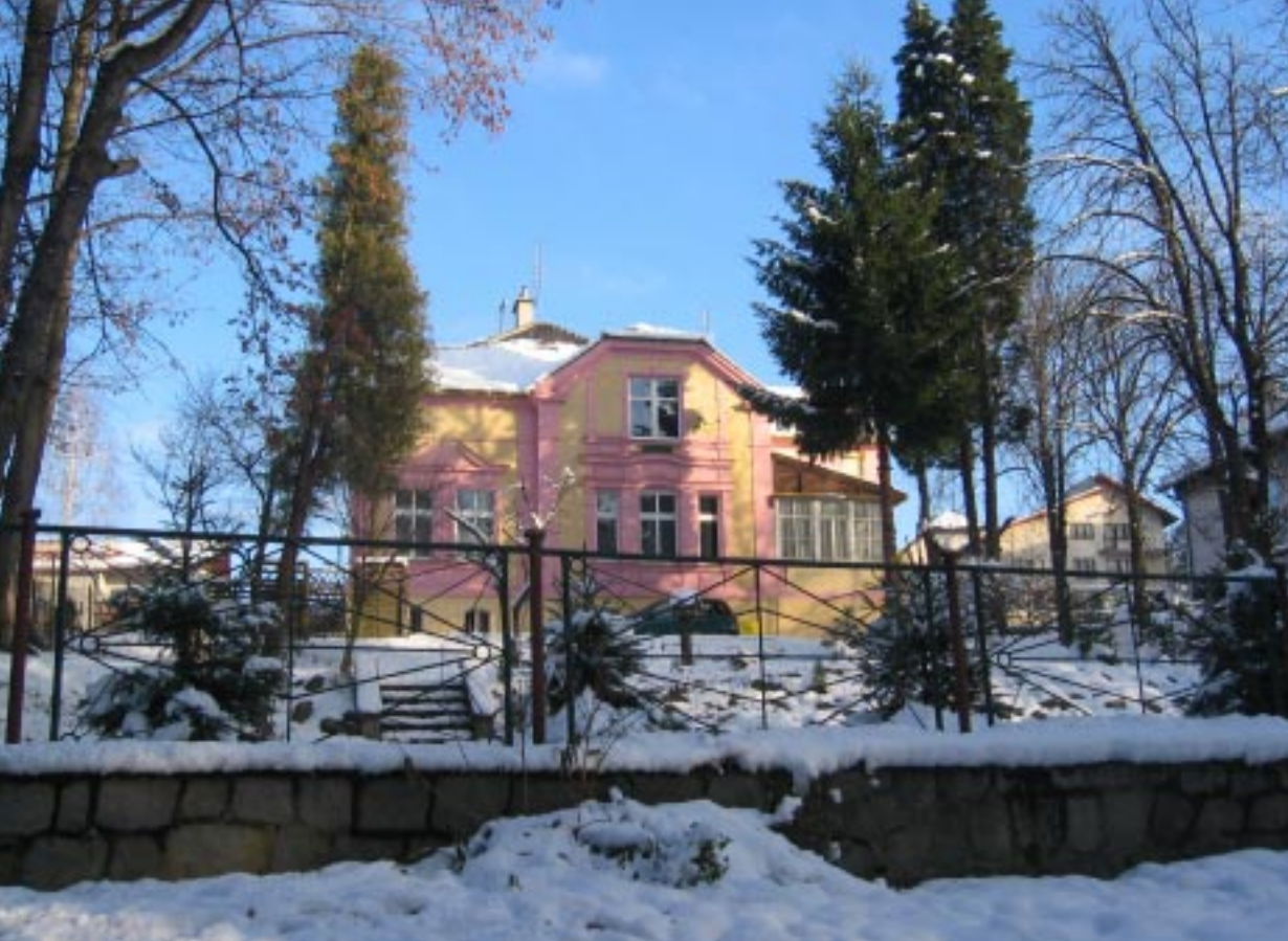
Glucholazy. Zabudowa zdrojowa Glucholazy, lázeňské budovy Glucholazy. Das Kurhaus