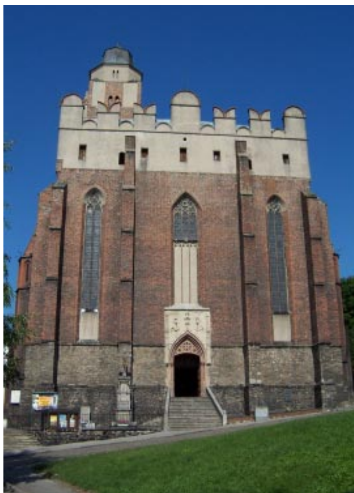
Fortyfikacje w Paczkowie Opevnění v Paczkově Befestigungen in Paczków