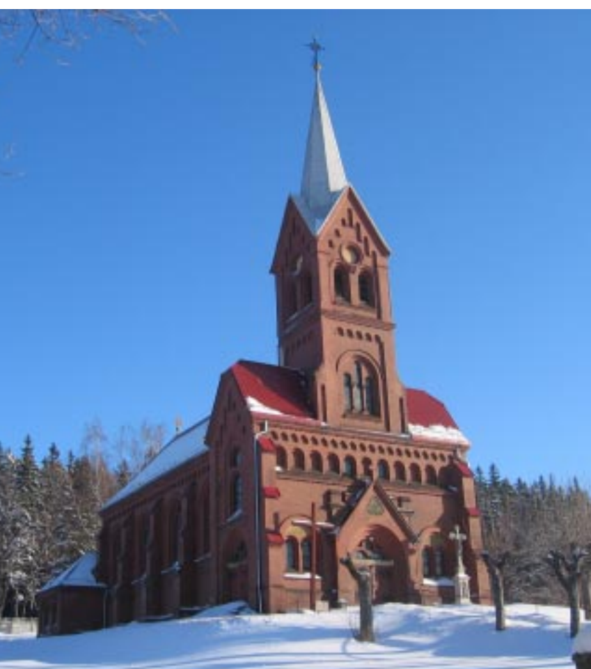
Kościół w Podlesiu Kostel v Podlesí Die Kirche zu Podlesie