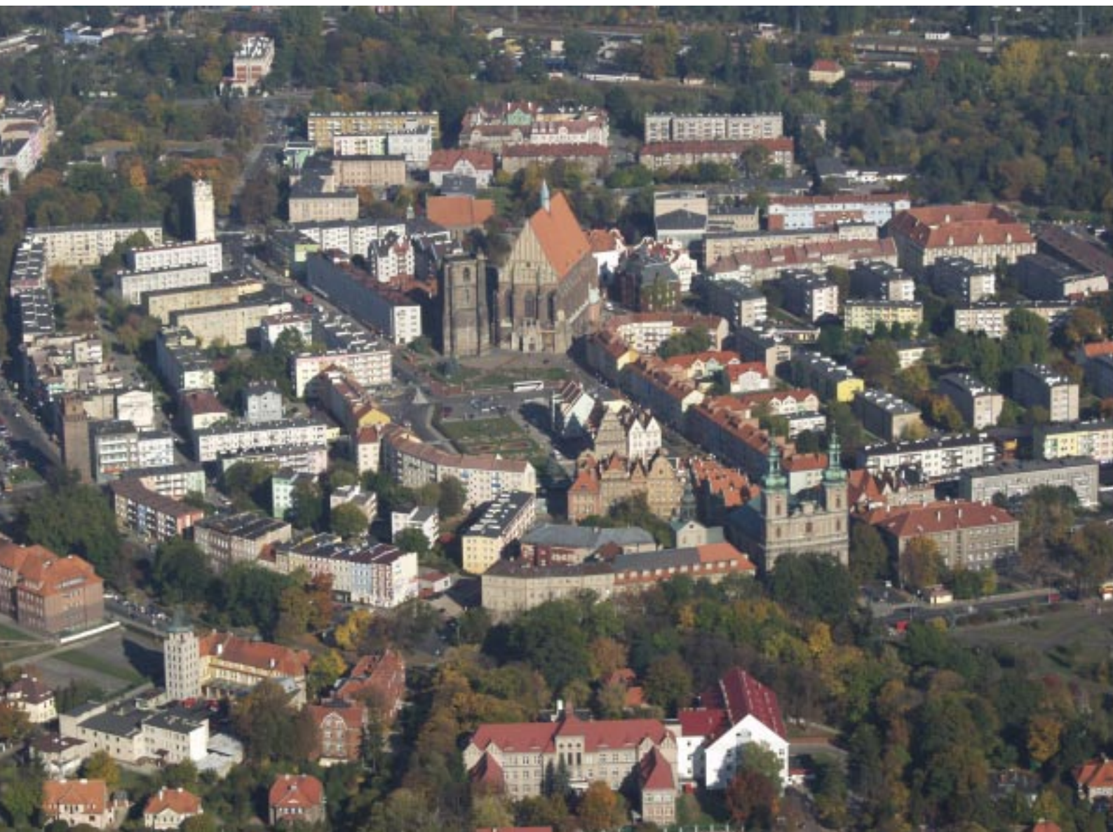
Nysa. Centrum miasta Nysa, centrum města Nysa. Die Stadtmitte