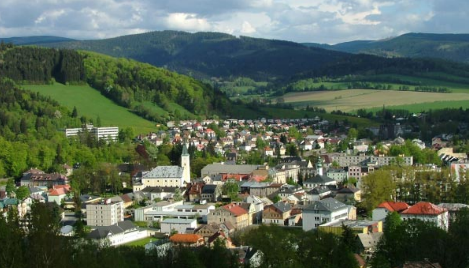
Jeseník. Panorama Jeseník, panoráma Jeseník. Ein Panoramablick