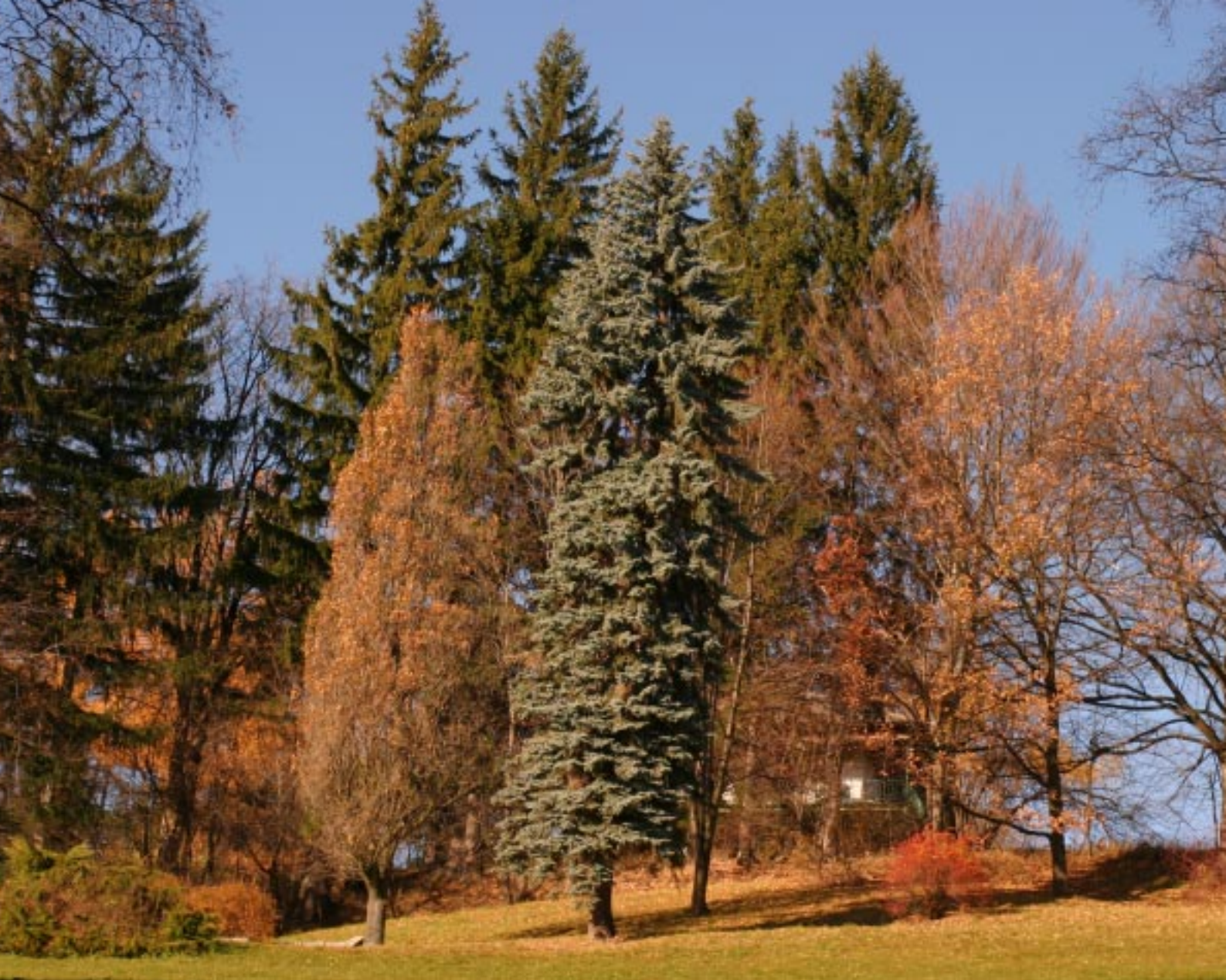
Lázně Jeseník. Promenada Lázně Jeseník, promenáda Eine Promenade in Lázně Jeseník