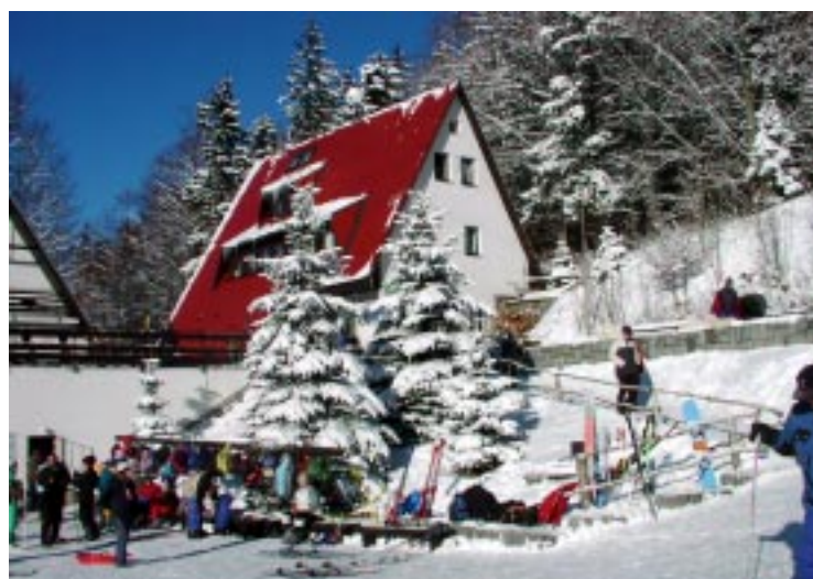
Lipová-lázně. Ośrodek narciarski „Na Miroslavi” Lipová-lázně, lyžařský areál „Na Miroslavi” Lipová-lázně. Skizentrum „Na Miroslavi”