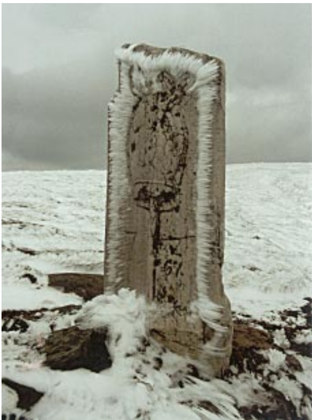
Dawny słup graniczny na szczycie Pradziada Bývalý hraniční sloup na vrcholu Pradědu Ein alter Grenzpfosten auf dem Gipfel der Altvater