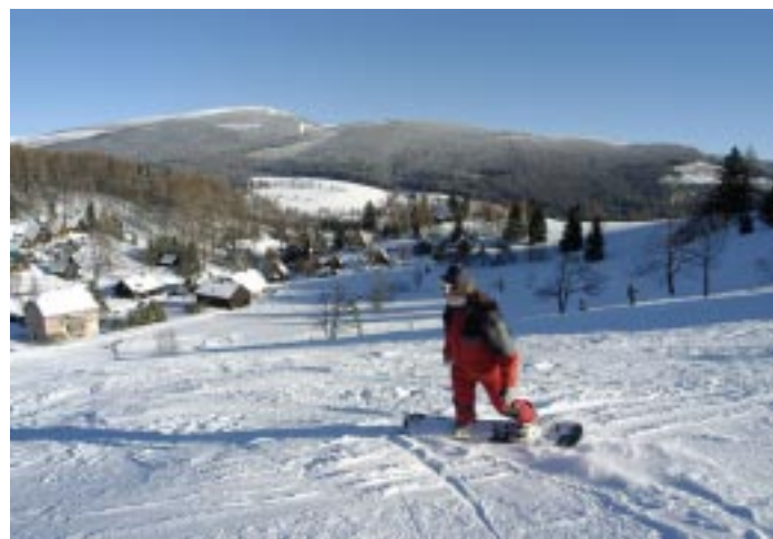
Ośrodek narciarski Ostružná Ski areál Ostružná Skizentrum Ostružná