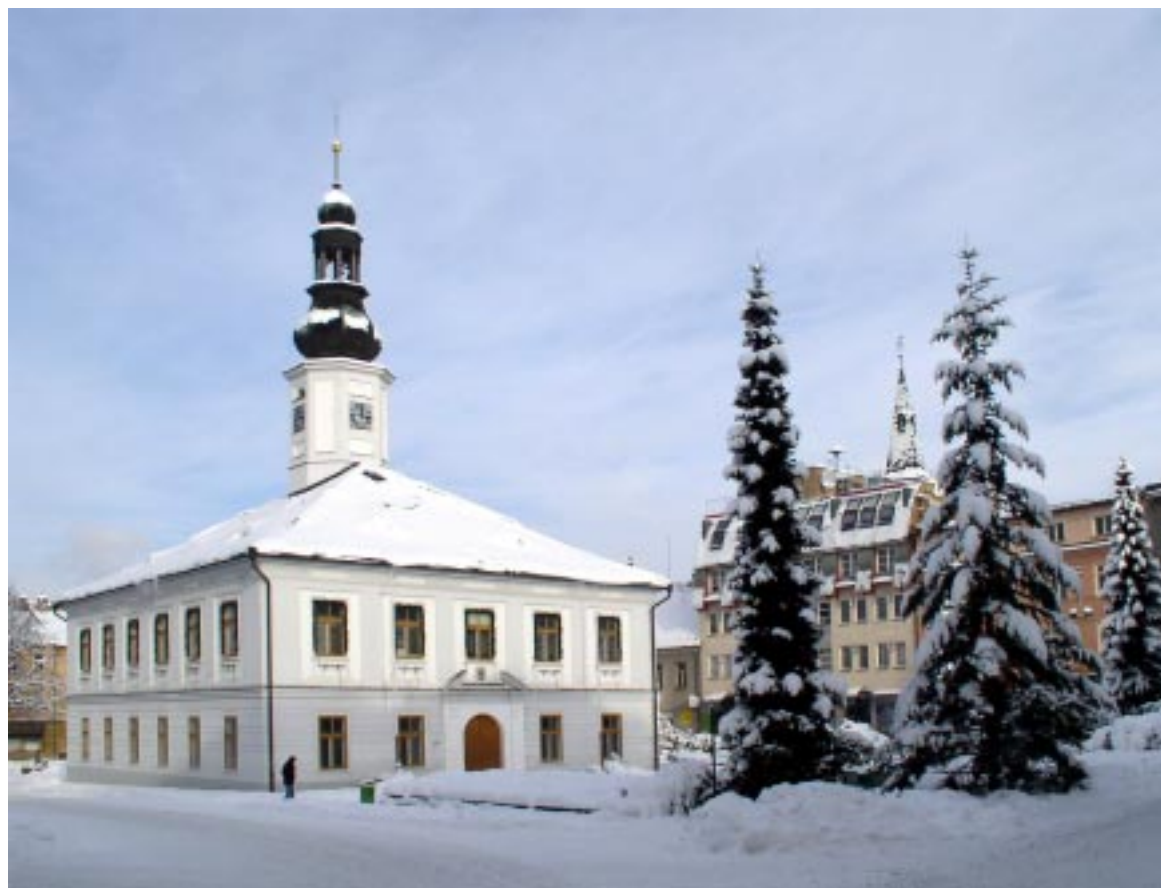
Jesenik. Ratusz Jesenik, radnice Jesenik. Das Rathaus