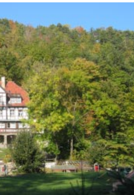
Jarnołtówek. Die Rehabilitations- und Heilklinik für Kinder „Aleksandrówka“