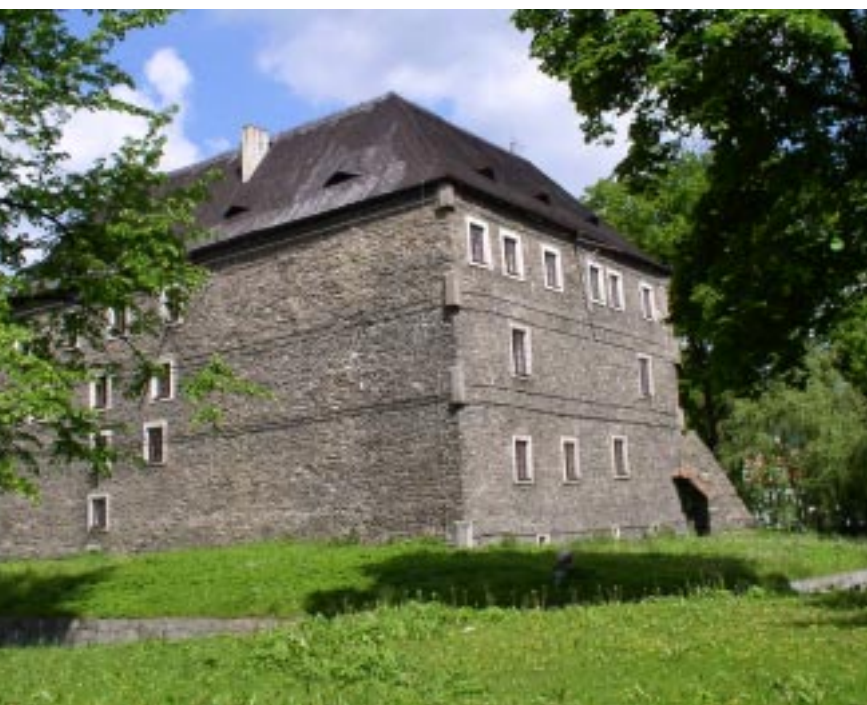
Jeseník. Twierdza Wodna Jeseník, Vodní tvrz Jeseník. Die Wasserburg