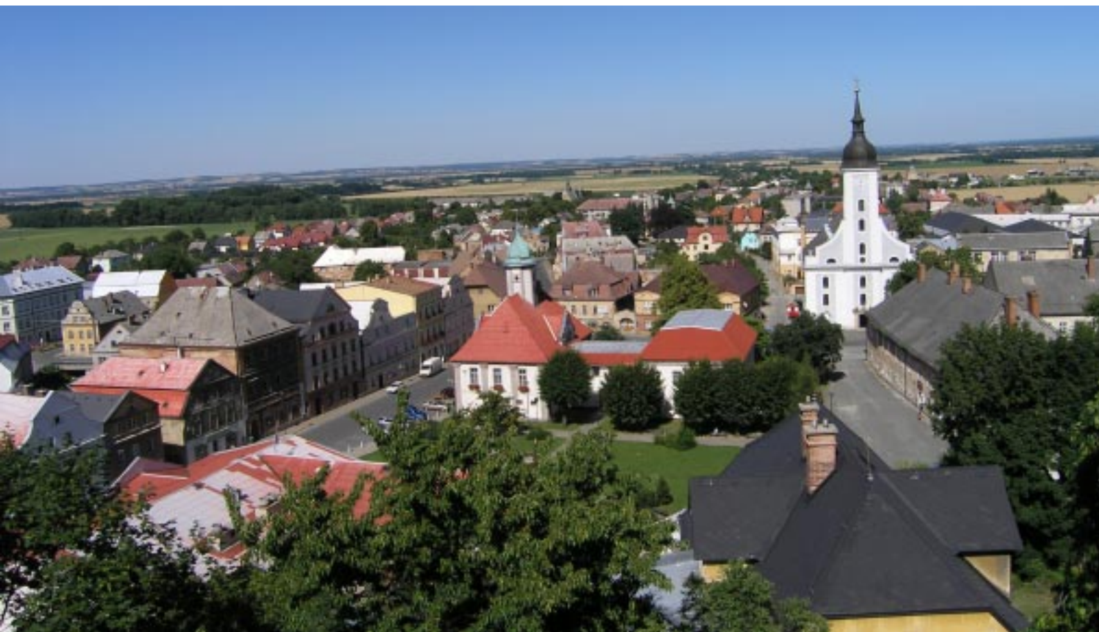
Javorník. Widok od strony zamku Javorník, pohled ze zámku Javorník. Aussicht vom Schloss