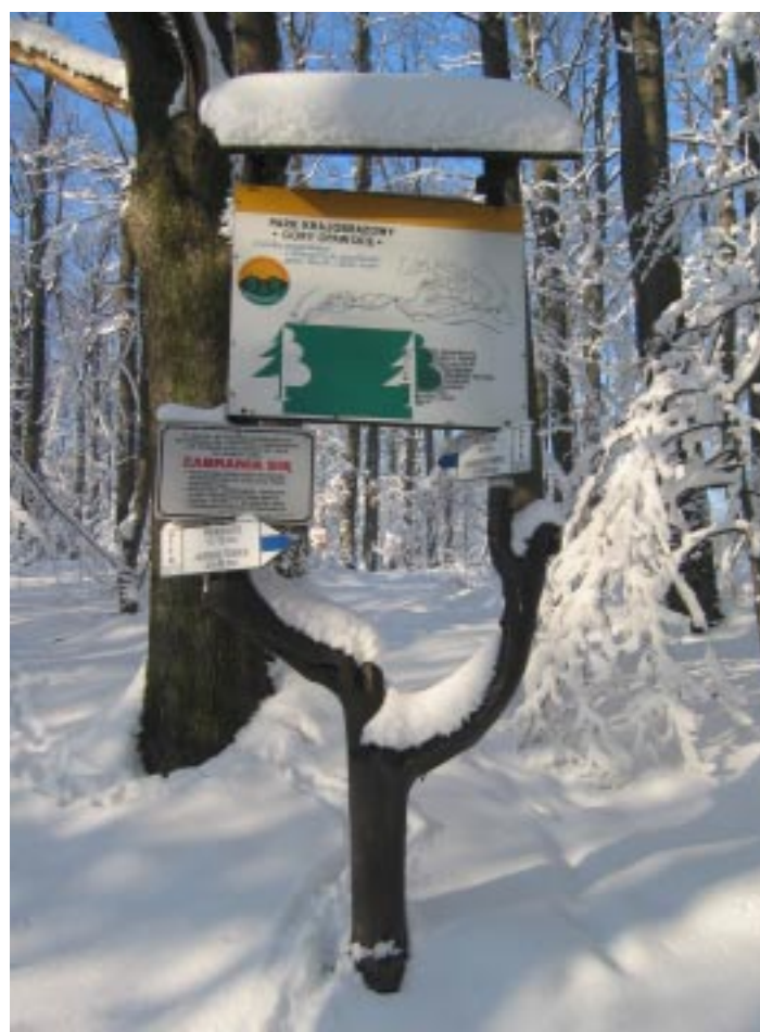
Tablica informacyjna w Parku Krajobrazowym „Góry Opawskie” Informační tabule v Krajinném parku Góry Opawskie Eine Informationstafel im Landschaftspark „Troppauer Hügelland“