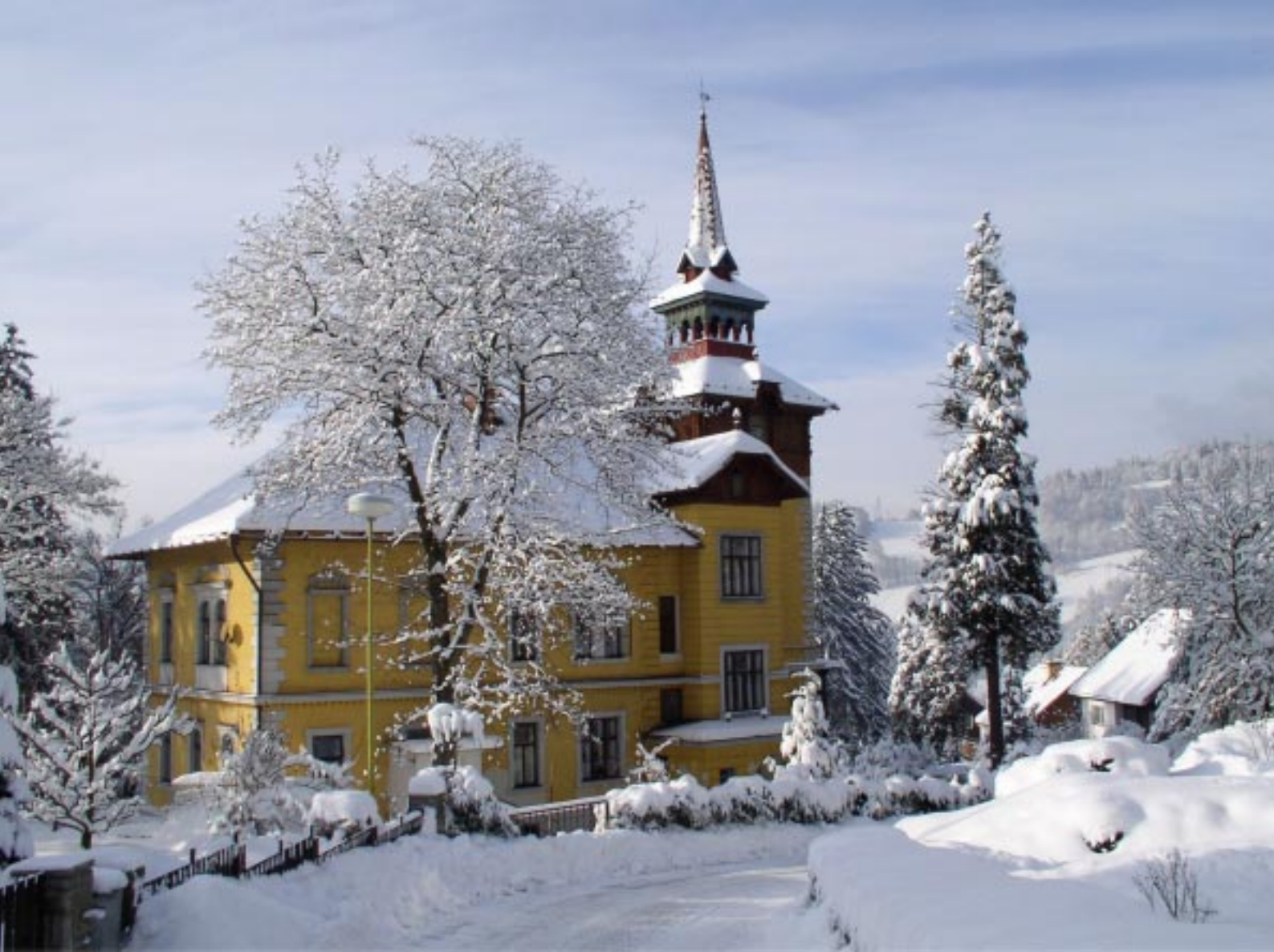
Jesenik. Ulica Skupowa Jesenik, Skupova ulice Jesenik. Die Skupova-Straße