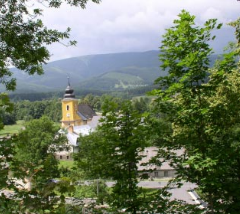
Domaszów. Kościół górny