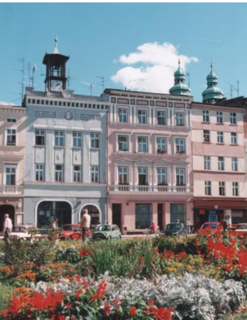
Das Troppauer Hügelland. Ein Naturdenkmal – die Stieleiche (Quercus robur)