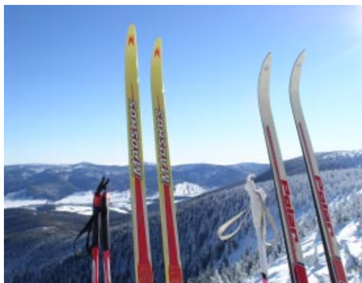
Weekend w górach Víkend na horách Ein Wochenende im Gebirge