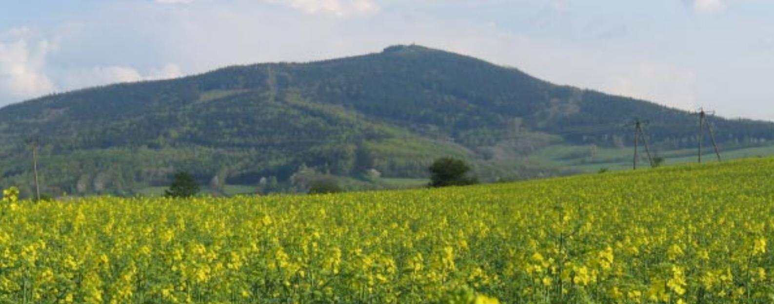
Biskupia Kopa Biskupská kupa Die Bischofskoppe