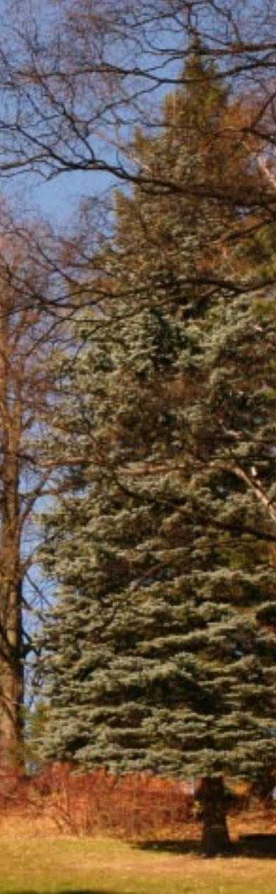
Jawornik. Zamek Jawornik, zámek Jawornik. Das Schloss