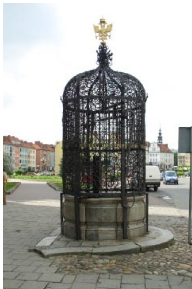
Nysa. Piękna Studnia Nysa, Pěkná studna Nysa. Der Schöne Brunnen