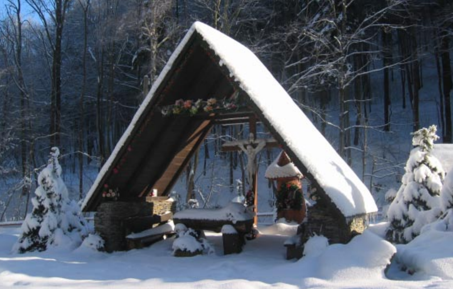
Kaplica polowa w Cichej Dolinie Polní kaple v Tichém údolí Die Feldkapelle im Stillen Tal