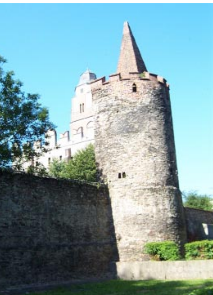
Paczków. Kościół pw. św. Jana Ewangelisty Paczków, kostel sv. Jana Evangelisty Paczków. Die Johannes-Kirche