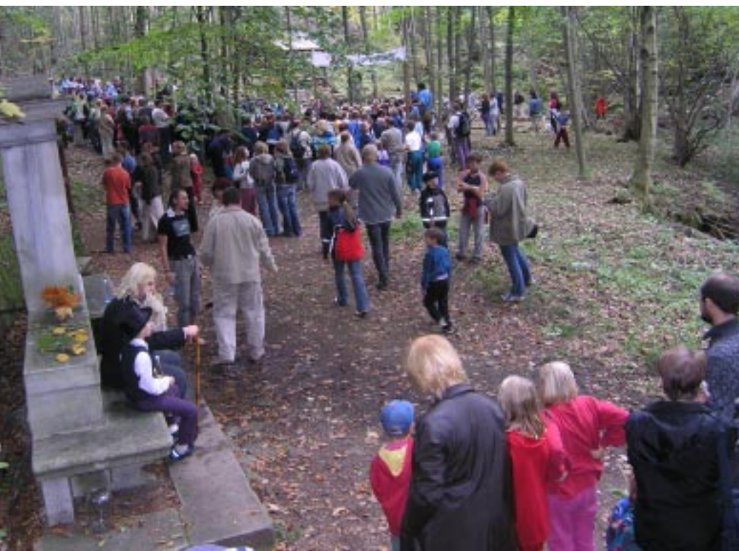
Lázně Jeseník. Ścieżka przyrodniczo-dydaktyczna Lázně Jeseník, naučná přírodní stezka Lázně Jeseník. Ein didaktischer Naturweg