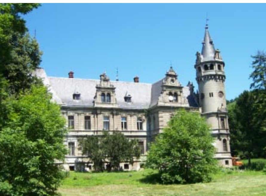
Pałac w Rysiowicach Zámek v Rysiowicích Palast in Rysiowice