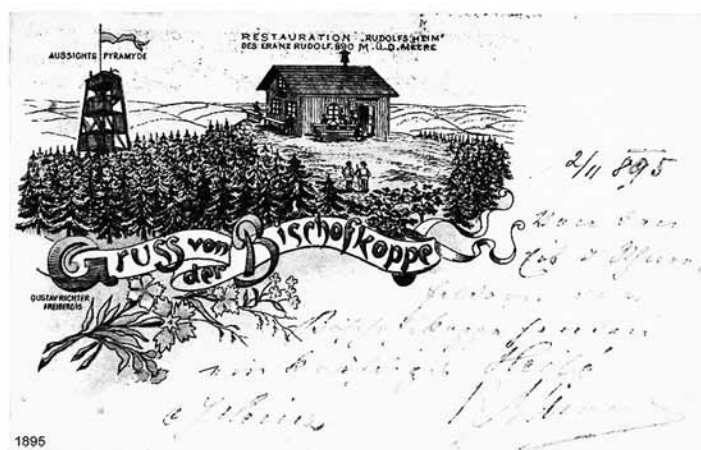
Pierwsze schronisko Rudolfsheim, stojące jeszcze tuż pod szczytem Kopy Biskupiej.

Utworzone w 1881 roku w Jeseniku Morawsko-Śląskie Sudeckie Towarzystwo Górskie (MSSGV), czyniło wszelkie starania o jak najszersze rozpropagowanie turystycznych walorów Jeseników. Jednym z pomysłów na to była budowa wież widokowych, usytuowanych na szczytach, lub tuż pod, najważniejszych jesenickich wierzchów. Podobnie jak przy budowie górskich schronisk, tak i w tym przypadku realizację tych zamierzeń uzależniano od pomocy właścicieli tutejszych lasów, głównie biskupów wrocławskich i książąt Liechtenštejn.