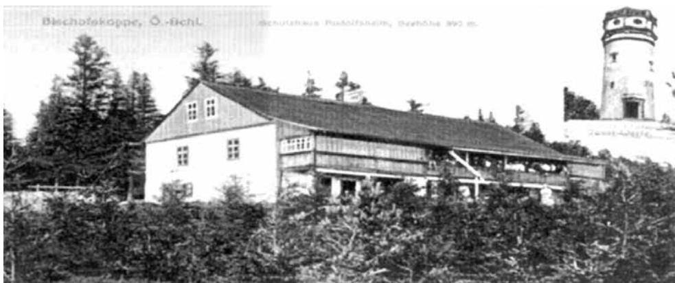
Schronisko Rudolfsheim po rozbudowie w 1905 r. Pocztówka ze zbiorów autora.

W tym czasie zlatohorska sekcja MSSGV, przymierzała się już do pewnych prac remontowych na wieży. W tej sytuacji mogła zmie-