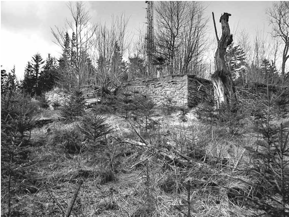
Ruiny schroniska Rudolfsheim od strony południowej, stan z października 2002 roku.