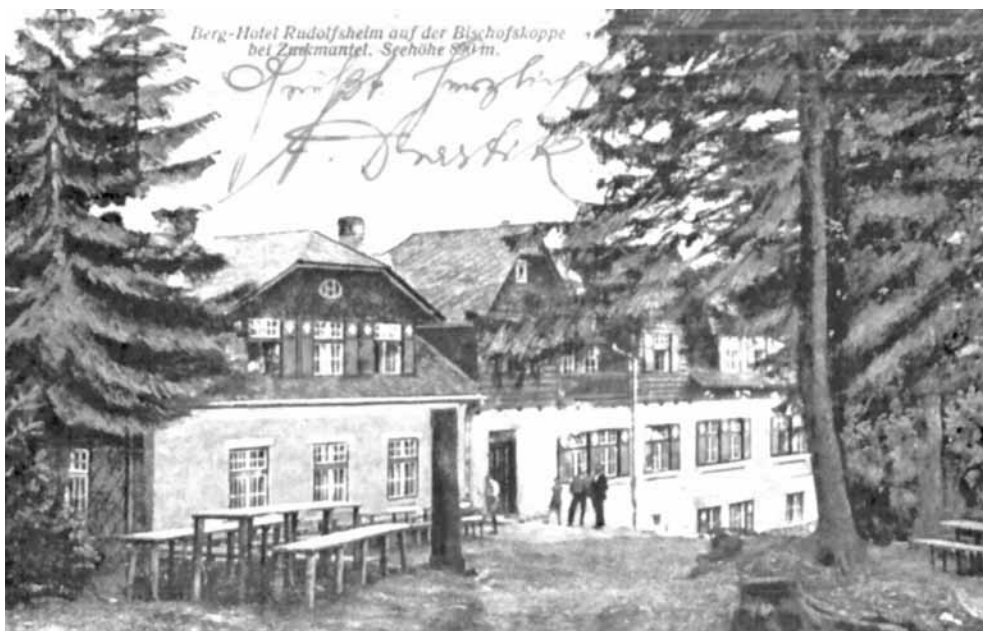
Schronisko po przebudowie na początku lat dwudziestych XX wieku. Pocztaówka ze zbiorów autora

Natomiast od roku 1908 w Rudolfsheim, można było nawet skorzystać z telefonu.