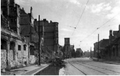
Jedna z ulic zbombardowanego Wrocławia, w tle kościół św. Maurycego

stwa ucieczki. Oblężenie stolicy Dolnego Śląska rozpoczęło się 16 lutego 1945 r. Rosyjskie plany zdobycia miasta w przeciągu czterech dni przedłużyły się dwudziestokrotnie, gdyż dopiero po osiemdziesięciu dniach, od zamknięcia okrążenia, ogłoszono jego kapitulację.